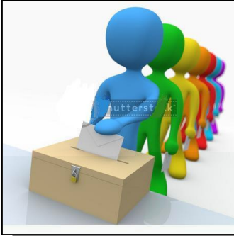
Immagine digitale, archivio fotografico Shutterstock.