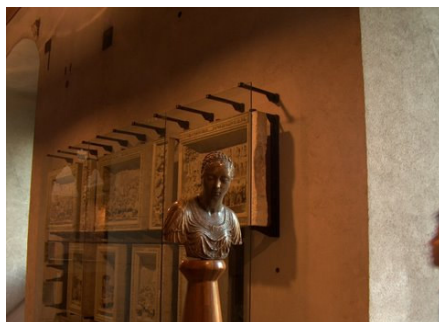
Stefano Pifferi, Busto di nobildonna.