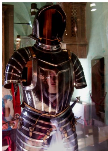
Lucrezia Spagnoletti, Armatura cinquecentesca.

Il 17 di ottobre in presidenza è arrivato il bando di un concorso fotografico indetto dalla Regione Lombardia, volto a raccogliere immagini scattate dai ragazzi delle scuole primarie e secondarie, che esaltassero le bellezze del paesaggio e dei monumenti della nostra regione.